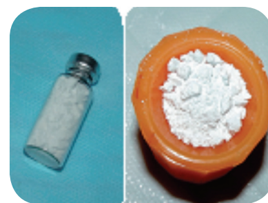
3. Beta Trifosfato de Cálcio.