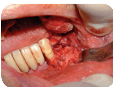
5. Aspecto final do