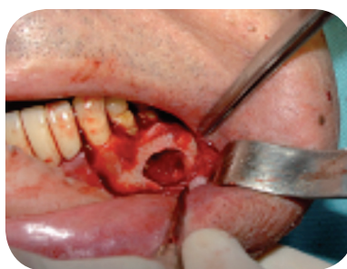
2. Exatise da lesão.