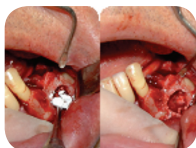
4. Acondicionamento do material na